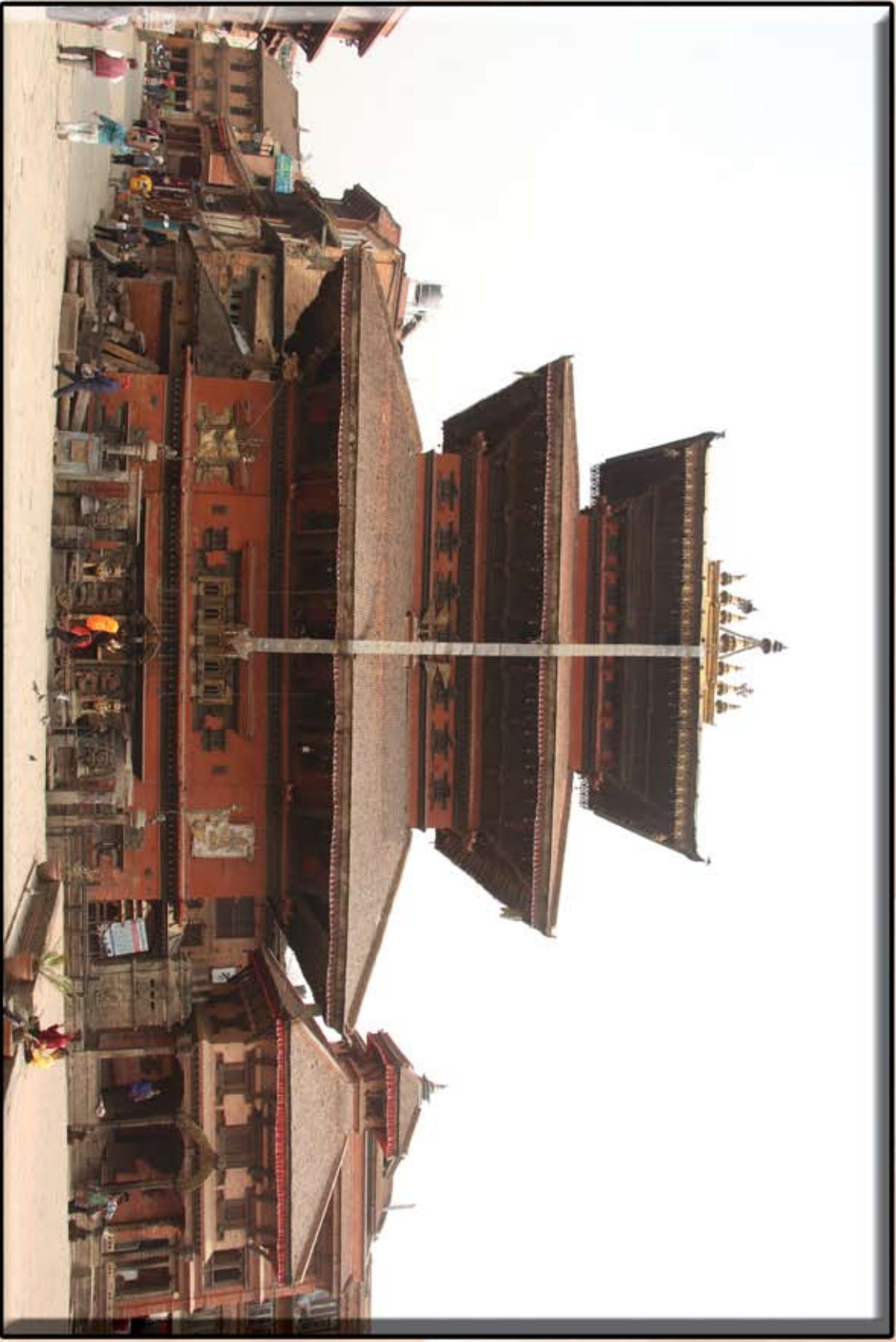
शिवका जात्राया मूलमका शैलद्योया देवाः शैल देवाः