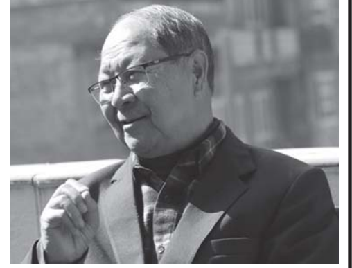
माक्सवाद पुलांजुल धाइपिन्ता छगू ग्यसुलागु लिसः

नेपाल संवत् १९३९ बछलाथ्व/२०७६ जेठ १/ 2019 May/ ल्याः१३, दाँः१