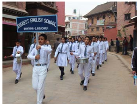
एभरेष्ट इ. स्कूल व डेमोस मावि (हपाः)