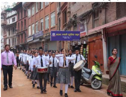
माउण्ड भ्याली (ल्यूया ल्यू)