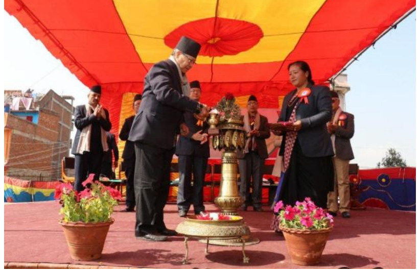
स्वप नपाया प्यकःगु नगरसभा उलेज्याय् मूपाहाँ नेमकिपाया नायो नारायणमान विजुकछें

अमेरिकाय् सरकारी खर्चया व्यवस्था याय् मफयो अथेथथे मदयो चवंगु भारते धर्म, जात व भाय्या लिधंसाय् राजनीतियाड फासीवादया लाँपुइ वानेगु कुतः याड चवंगु खाँयात कायो कम्बोडियाया राजनीतिक इतिहासया खाँ कडदिल । एशियाय् थःमनं हालिमुहाली याय्ता जुम्हा अमेरिकायाता नेपालं बांलाक थुकइके मःगु खः । उकिं थी थी देशे आधार शिविर दय्क वयो चवंगु अमेरिकन पलां भूतानं न्हय यो धाधां कम्बोडियाया राजनीतिक इतिहासं थुइकेमःगु खः धायोदिल । बिमस्टेकया बैठक चवड सार्कया बैठक मचवंगु भारतीय विस्तारवादया थःगु हे स्थार्थ दःगु