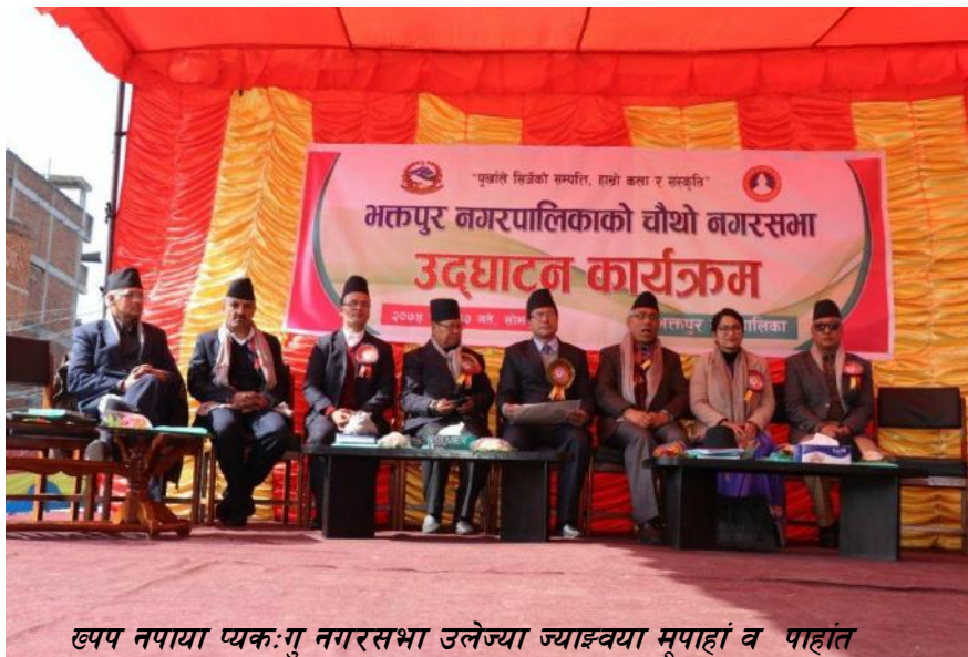
ख्वप नपाया प्यकःगु नगरसभा उलेज्या ज्याइवया मूपाहां व पाहांत

मति तयाथें अनुभूति याय् मखानि । संघीय सरकारया च्वय् च्वय् च्वपुं पदाधिकारी तय्सं संविधानं स्थानीय तहता ब्यूगु अधिकार नपां विय्गु मतिमत । अमिगु मति न्हपायाय्थें हे केन्द्र सरकारं आदेशयाड शासन याय्गु कुमति खानेदः । नेपःया संविधान व स्थानीय सरकार सञ्चालन ऐन २०७४ रं ब्यूगु अधिकारनपां थी थी त्वहः माल लिफ्यनेगु कुतः याड च्वंगु खानेदः । आ.व. २०७५/२०७६ या बजेटं स्मारक