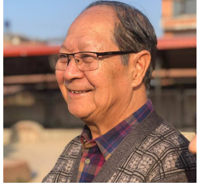
नेमकिपाया नायो का.नारायणमान बिजुक्छें (रोहित)

अथेजगुलिं चिच्याहिले थःगु मां भाय् व थःगु हे देयया भाय् ब्वंकेगु, च्यागू-हिगू तगिंखय् वा हिंछगू तगिंखय् जक छगू विदेशी भाय् अनिवार्य यासा न्हूगु पुस्तां थःगु मां भाय् व विदेशी भायनं ल्हाय सय्की । निजी स्कूले मां भाय् व (नेपाली) भाय् बांलाक ल्हाइपिसं नेपाली भाय्या ल्या व खॉंवः या उच्चारण यायता हे थाकु चःगु यक्व उदाहरण त दः ।